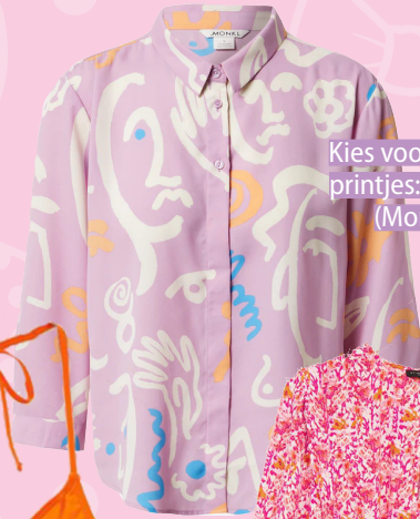
Kies voor gekke printjes: € 19,99 (Monki)