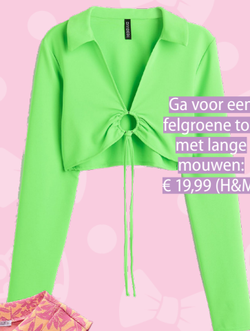
Ga voor een felgroene top met lange mouwen: € 19,99 (H&M)