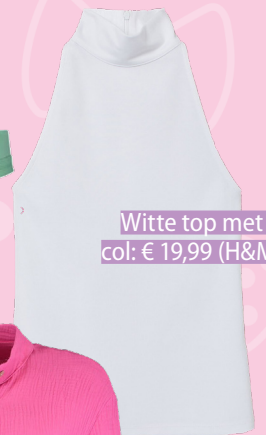
Witte top met col: € 19,99 (H&M)

NET ALS JADE ANNA Shop in de stijl van Jade Anna en jouw zomer garderobe is on fleek!