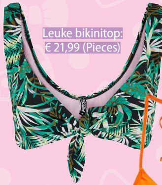
Leuke bikinitop: € 21,99 (Pieces)