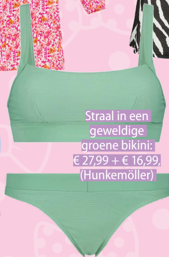
Straal in een geweldige groene bikini: € 27,99 + € 16,99 (Hunkemöller)