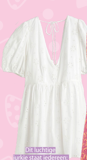
Dit luchtige jurkje staat iedereen: € 39,99 (H&M)

Tip: check de mannenafdeling of haal er een uit de kast van je vader of broer.