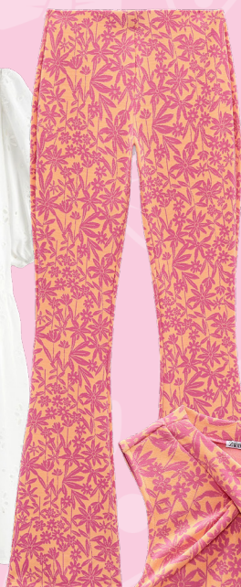
Shop een top en broek in dezelfde print: € 19,95 + € 12,95 (Zara)