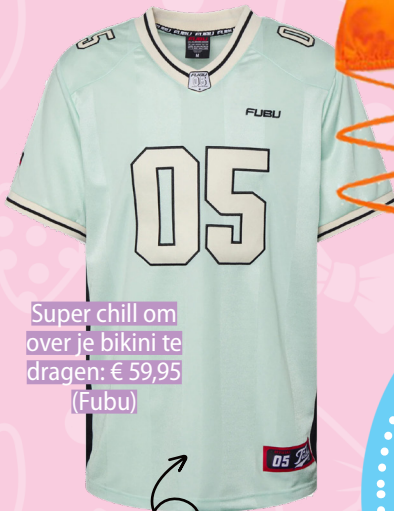
Super chill om over je bikini te dragen: € 59,95 (Fubu)