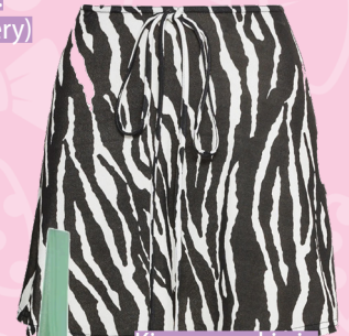
Kies een rokje in zebra print: € 21,99 (MissGuided)