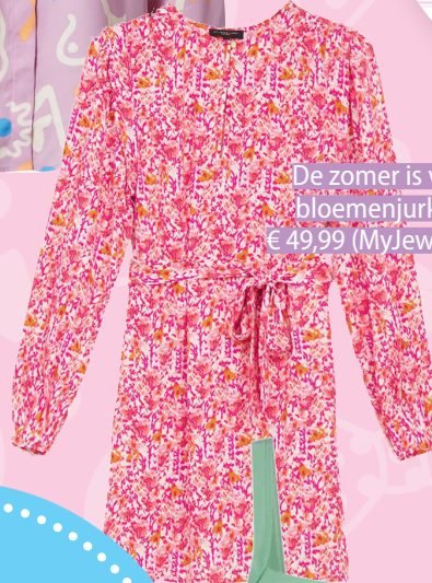
De zomer is voor bloemenjurkjes: € 49,99 (My Jewellery)