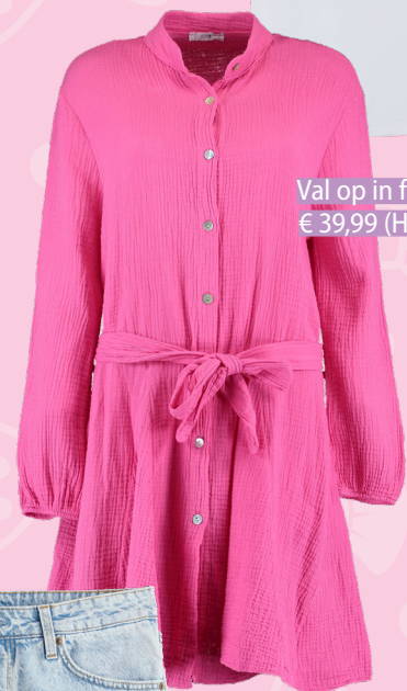
Val op in felroze: € 39,99 (Haileys)