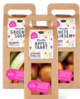
Je vindt de pakketten in het speciale 'Van mij, voor jou'-display.

Deze lekkere klets pakketten zijn in de Week tegen Eenzaamheid (1 t/m 8 oktober) verkrijgbaar en daarna zo lang de voorraad strekt. Pakket + verpakking vanaf 4 euro.