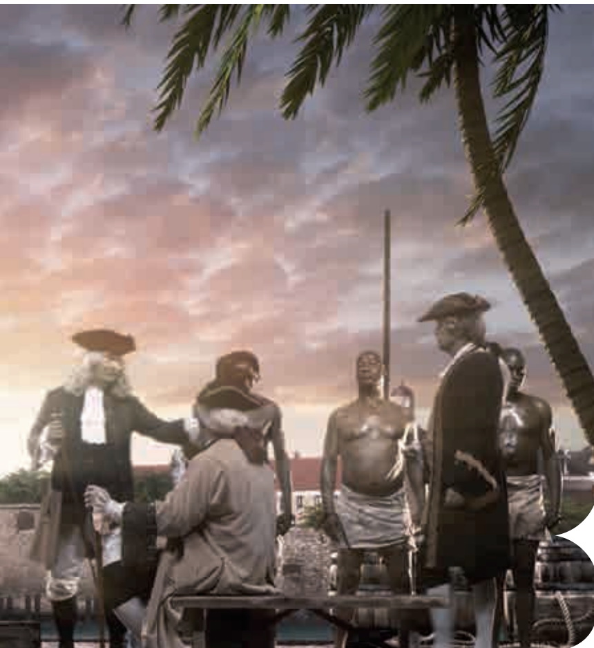
Werkwijze van de slavenhandelaren aan de kade van Willemstad.